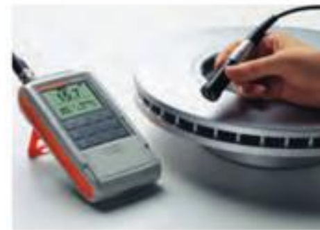
DELTASCOPE® FMP30 配合双触点探头V7FKB4 - 测量卡车刹车盘