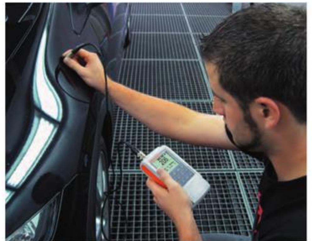
使用FD10探头测量油漆的厚度。