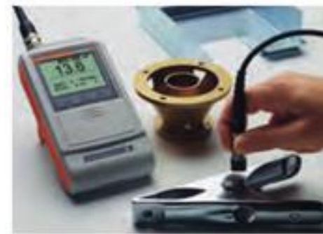
DUALSCOPE® FMP40 配合FD13探头 - 测量各种小零件