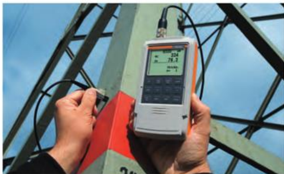
使用DUAL SCOPE® FMP40以及FDX10两用探头在室外进行测量。

能够自动识别底材材料并且集成了两种测量方法, 使这个系列的仪器可以测量钢材和铁材亦或是非铁磁基材上的大部分涂镀层的厚度。由于集合了两种测量方法, 这个系列的仪器还能够在一次测量过程中同时测得两层涂镀层的厚度 (油漆层/锌层), 并且分别显示出来。