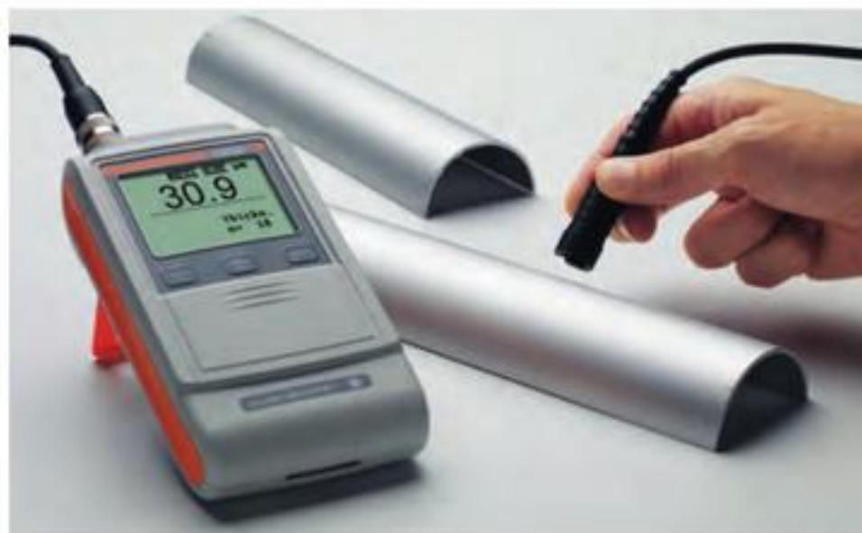
DUALSCOPE® FMP20 配合获得专利的曲率补偿探头FTD3.3测量 阳极氧化样品。