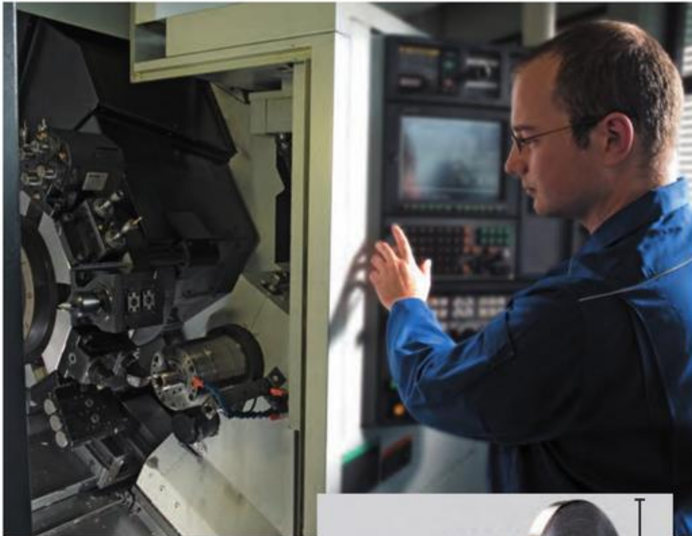
正在生产探头的部件 Helmut Fischer GmbH

下面的图表显示了选择探头的标准流程。我们的探头库中拥有超过100种适合不同应用的探头，除此之外，Helmut Fischer GmbH还能为您的应用特别定制探头。