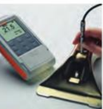
DELTA SCOPE® FMP10 – 配合FGAB1.3探头测量 铁上镀锌层。

FMP10和FMP20体现了全新FMP系列手持式仪器精确的测量技术。这些用户界面友好又坚固耐用的仪器配合可更换的探头使用可以满足所有的测量要求。它们能够显示重要的统计数据。您的测量结果可以与校准信息一起以应用程序的形式储存于仪器里,确保您每天快速、可靠地使用。