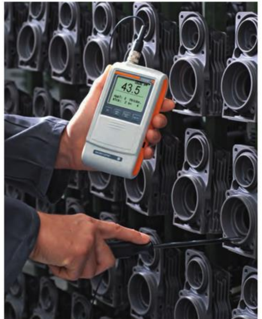
使用FAI 3.3-150探头进行测量。