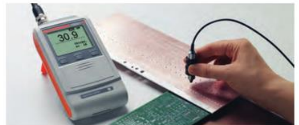
ISOSCOPE® FMP10 配合FTA3.3-Cu探头测量印刷线路板,铜板。