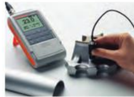
ISOSCOPE® FMP30 配合FTA3.3探头 - 测量轻合金边缘