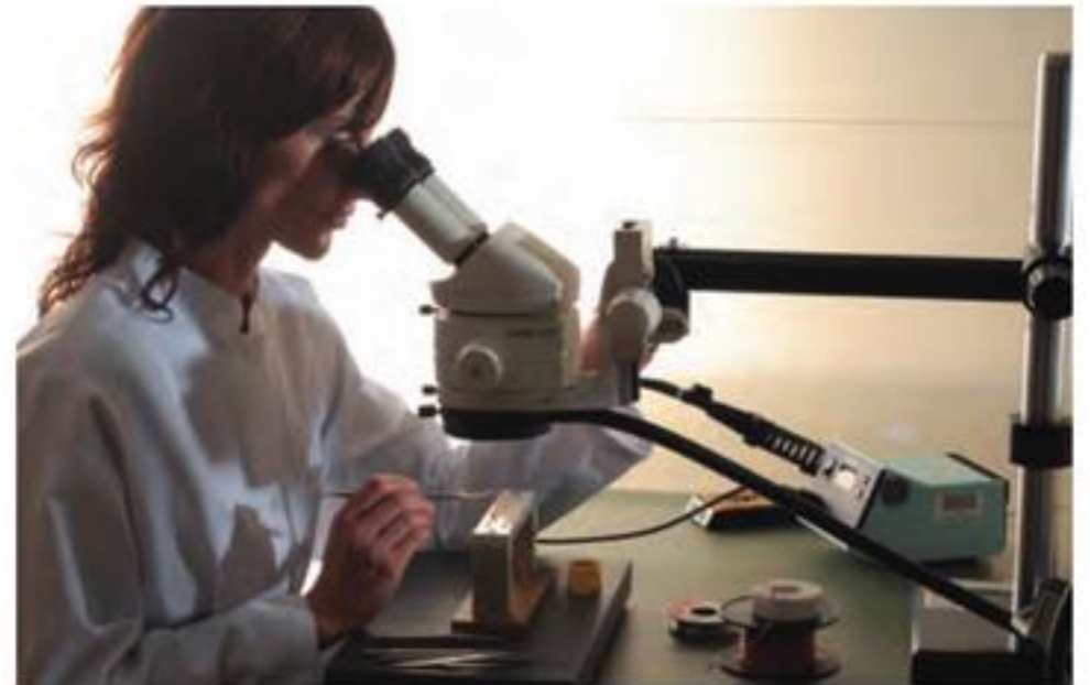
在显微镜下制作探头

一次测量的质量，主要由几个关键因素决定。包括：选择适当的探头和探头本身的质量等。Helmut Fischer GmbH为您提供种类繁多而又品质卓越的高精度探头，所有探头都是按照最高的品质要求自行开发和生产。