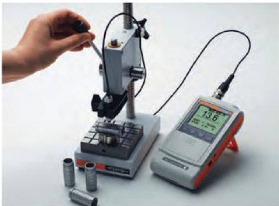
DUALSCOPE® FMP40配合FGA2H 探头和工作台使用，在夹具的定位下测量圆柱形工件。